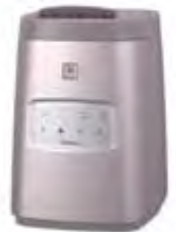
カラー：ピンクゴールド

Neo reju・pou スパークリングミスト スターターセット 定価 ¥39,900 (税込)